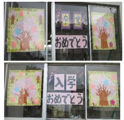
パートナーさん手作りメッセージ

ひのच्छから連絡が必要な時もありますのでちのच्छの携帯電話の電話帳などへの電話番号の登録もお願いします。 ◎ひのच्छに参加して遊び、帰る時に忘れ物が出ますので身の回りの持ち物や上着などに名前の記入をお願いします。名前のない物は、学校の忘れ物置き場に置いておきますので、ご確認ください。