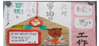
2月の工作、えまこうさく